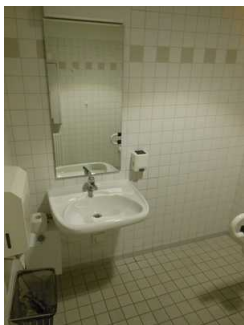
Waschbecken im WC