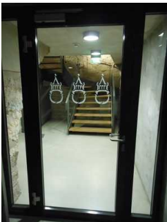
Tür zur Ausstellung