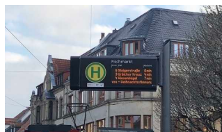
Digitale Anzeigetafel der Linien