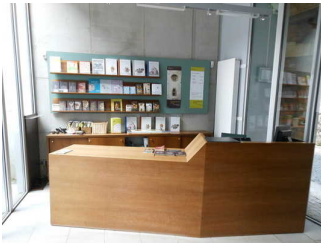
Kasse und Information

Das Kassendisplay/die Preisangabe an der Kasse ist nicht gut erkennbar (z.B. groß oder schwenkbar).