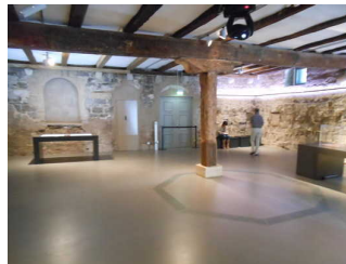
Ausstellungsraum im Erdgeschoss

Informationen zu den Exponaten werden schriftlich vermittelt. Informationen zu den Exponaten sind als fotorealistische Darstellung vorhanden.