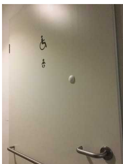
WC-Tür mit Piktogramm

Die Toilette gehört zu: Ausstellung im Erdgeschoss