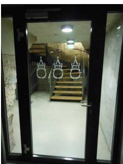
Tür zur Ausstellung baugleich Erdgeschoss