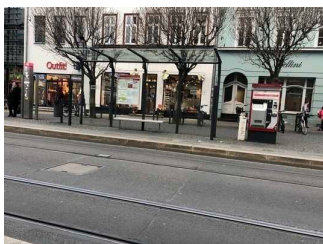
Haltestelle und Sitzmöglichkeit