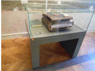
Exponate in Vitrinen