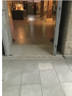
Tür zur Ausstellung im Obergeschoss

Informationen zu den Exponaten werden schriftlich vermittelt.