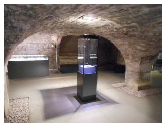
Ausstellung im Untergeschoss