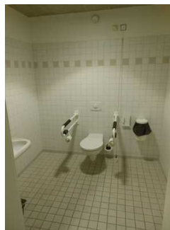
WC mit Haltegriffen