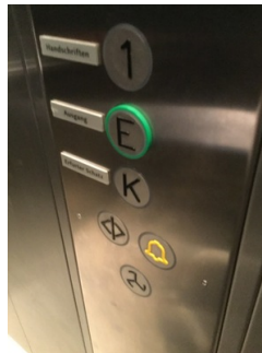
Tastatur im Aufzug

Über den Aufzug sind zu erreichen: Ausstellung im Erdgeschoss , Schatzausstellung im Untergeschoss , Ausstellung Schriften im Obergeschoss , Öffentliches WC